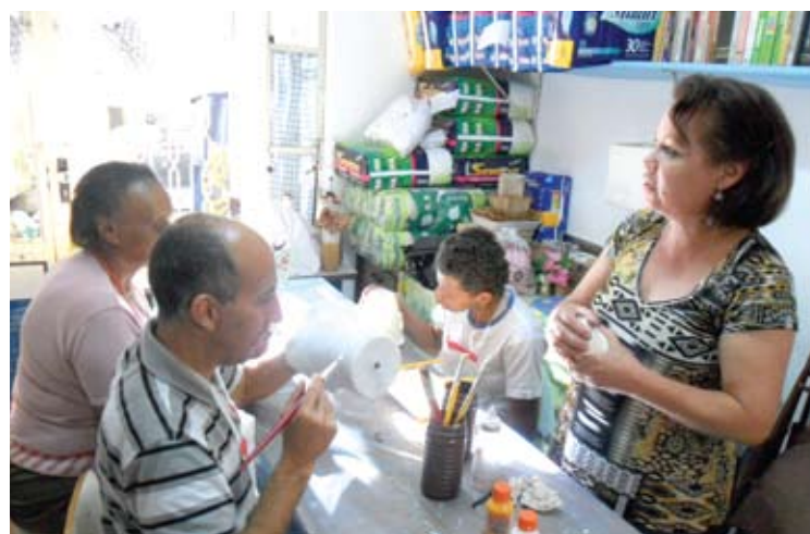
Aula de pintura e decupagem