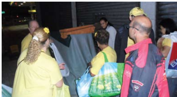
Lanches e roupas são distribuídos nas ruas de São Paulo

“Fazer o bem sem olhar a quem”, a máxima deixada por Jesus ganha sentido quando você vê um grupo de 15 pessoas reunir-se em uma noite de sexta-feira para produzir lanches e separar roupas, calçados, cobertores, roupas íntimas de homens e mulheres, entre outros objetos que julgam necessários. O objetivo? Uma caravana quinzenal nas ruas do Centro de São Paulo, conhecida como