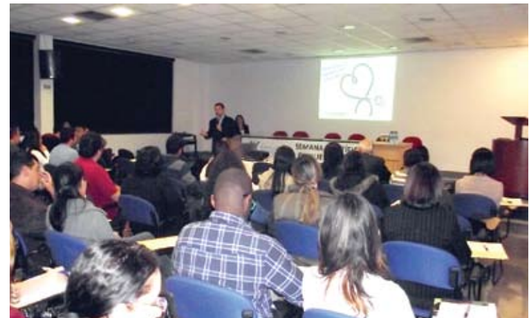
Humanização foi tema da Semana Científica do Cinquentenário do Hospital Carlos Chagas

de Prevenção de Acidentes e Maus-tratos na Infância e Adolescência de Guarulhos. O XI Fórum de Enfermagem de Guarulhos e o I Fórum do Alto Tietê, foram sediados no auditório da APM, na manhã de 7 de agosto. À noite, no mesmo local, tecnólogos, técnicos, auxiliares e estudantes em Radiologia participaram do VIII Encontro de Técnicos em Radiologia Médica de Guarulhos. A Semana Científica do Cinquentenário do Hospital Carlos Chagas contou com palestrantes de renome do setor de saúde e estendeu os trabalhos para professores da Rede Pública. Durante o Fórum de Prevenção de Acidentes e Maus Tratos na Infância e Adolescência