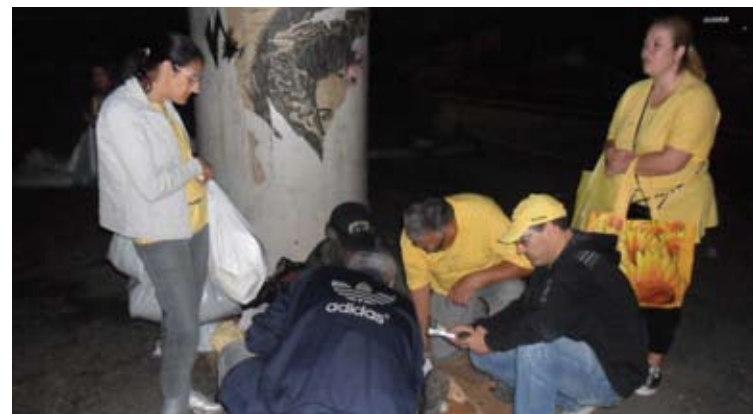
Cuidado e curativo no morador do viaduto embaixo do Minhocão