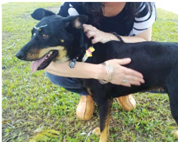
Cristal tem aproximadamente 2 anos

Lutando pela causa animal todos os dias, os protetores de nossa cidade cuidam de centenas de animais, mas querem dividir com você a alegria de amar e ser amado por um animalzinho. Veja como adotar e ajudar a causa animal.