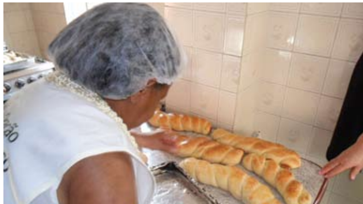
Panificação: pães deliciosos que complementam a renda da instituição