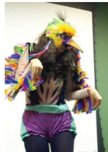
Arte em todo o canto

promover a cultura do protagonismo social para geração de alegria coletiva por meio da reunião de gente talentosa apaixonada por bons encontros. E sua visão é ser fonte cada vez melhor de inspiração, transpiração e transformação individual e coletiva. O Canto Cidadão realiza projetos como Cidadania em todos os cantos; arte em todo canto, academia de protagonistas; idiomas e cidadania, informática e cidadania, campanhas de mobilização e doação e doutores cidadão, um dos maiores grupos de voluntários palhaços hospitalares do mundo. Já foram