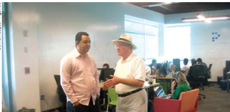
Encontro aconteceu em Stanford nos EUA