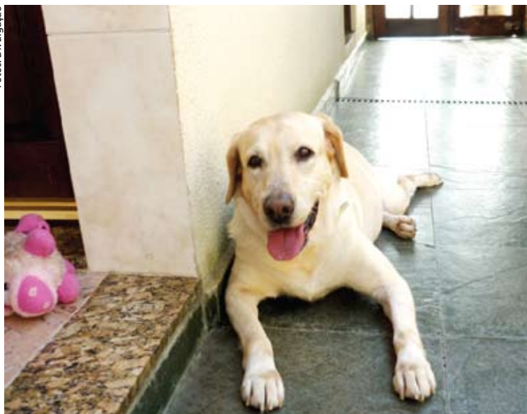
Vilma tem 8 anos e quer ser feliz

Lutando pela causa animal todos os dias, os protetores de nossa cidade cuidam de centenas de animais, mas querem dividir com você a alegria de amar e ser amado por um animalzinho.