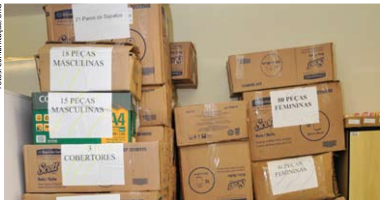
Mais de duas mil peças arrecadadas

No dia 10 de agosto, a Universidade Guarulhos repassou aos fundos sociais de solidariedade de Guarulhos e Itaquaquecetuba as doações recebidas durante a Campanha do Agasalho 2012, promovida em todos os campi da Instituição.