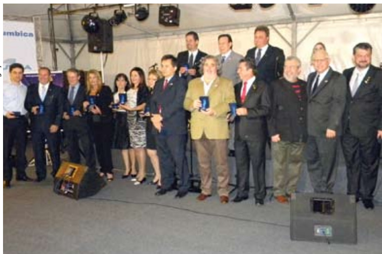
Ex-presidentes e atual diretoria são homenageados pelo trabalho à frente da entidade

Os 25 anos de fundação da Associação dos Empresários de Cumbica - BASF em Cumbica. A comemoração contou com