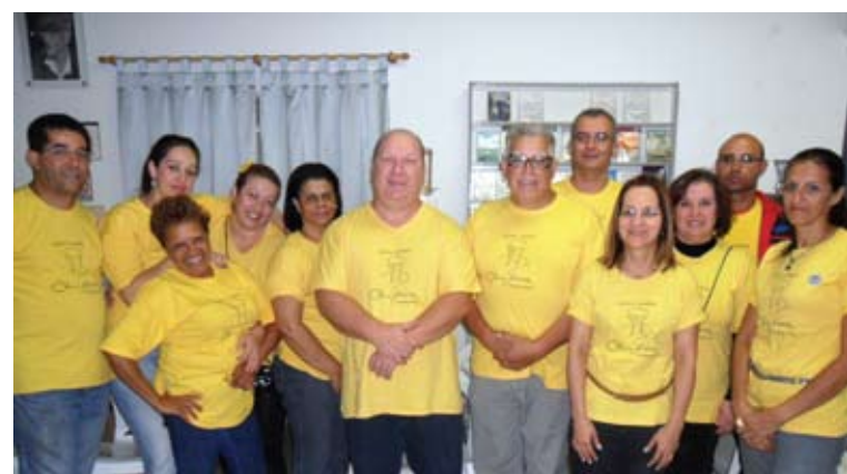
Equipe do Projeto Chico na Rua

Ao longo do percurso de mais de três horas, o grupo encontra pouca resistência. Os apertos de mão e abraços são a maior recompensa. Em média são atendidas