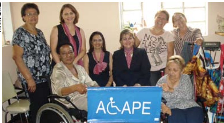
AGAPE atende pessoas com deficiência de toda a cidade

Segundo dados do Censo do IBGE realizado em 2010, o Brasil possui 45,6 milhões de pessoas com deficiência, sendo que Guarulhos contabiliza aproximadamente 140 mil pessoas com deficiência. Destas pessoas com deficiência, constam a visual, intelectual, auditiva, motora e outras deficiências múltiplas (quando da existência de duas ou mais deficiências associadas), isto sem contabilizar as que são geradas diariamente, infelizmente, por imprudências no trânsito e outros incidentes. Diante de todo este histórico, se faz necessário que projetos de acessibilidade e políticas públicas para inclusão