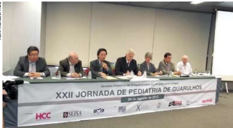
Evento contou com palestras, encontros e jornadas de especialistas e auditórios lotados

De 4 a 8 de agosto, o Grupo Carlos Chagas realizou a Semana Científica Cinquentenário do Hospital Carlos Chagas, em Guarulhos. Foram desenvolvidas Jornadas de Pediatria, Clínica Médica Cirúrgica, de Técnico em Radiologia, Enfermagem e Fórum de Prevenção de Acidentes e Maus-tratos na Infância e Adolescência.