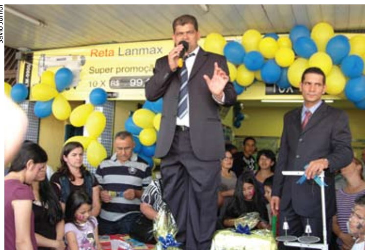
Evento de 2011 celebrou 21 anos de fundação da Casa de Máquinas do Baiano

outubro de 2006, por meio do projeto de Lei 6.181, sancionada pelo ex-prefeito Elói Pietá.