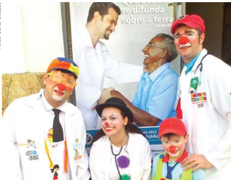
Canto Cidadão na Campanha da Fraternidade 2012

A ONG Canto Cidadão foi fundada há 10 anos com o intuito de utilizar a arte, a comunicação e o protagonismo para