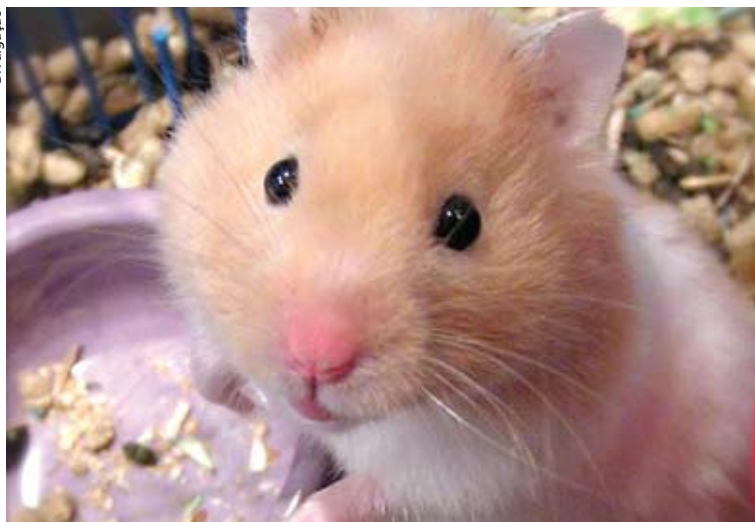
Hamster Sírio é um animalzinho com hábitos vespertino-noturnos

Nesta edição vamos falar sobre o Hamster Sírio (Nome Científico: Mesocricetus auratus ), que tem origem na Síria (Oriente Médio). Seu tamanho é entre 15 e 20 cm,