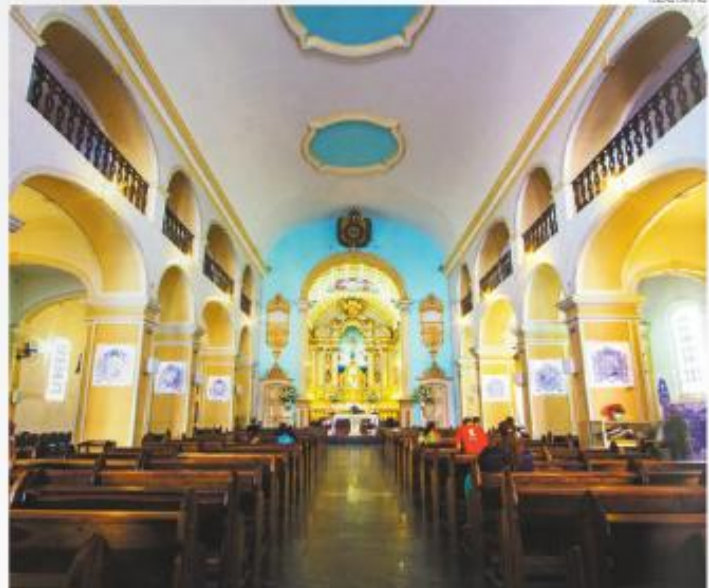
Reformada - Fiéis puderam voltar a fazer orações na igreja. As missas aconteceram no Colégio Virgo Patens

Havia o temor de risco de desabamento do teto da Catedral, porque as madeiras empenaram, mas os técnicos constataram que não tinha cupins. Ele adiantou que a igreja do Rosário, na João Gonçalves, deve ser reaberta no próximo ano.